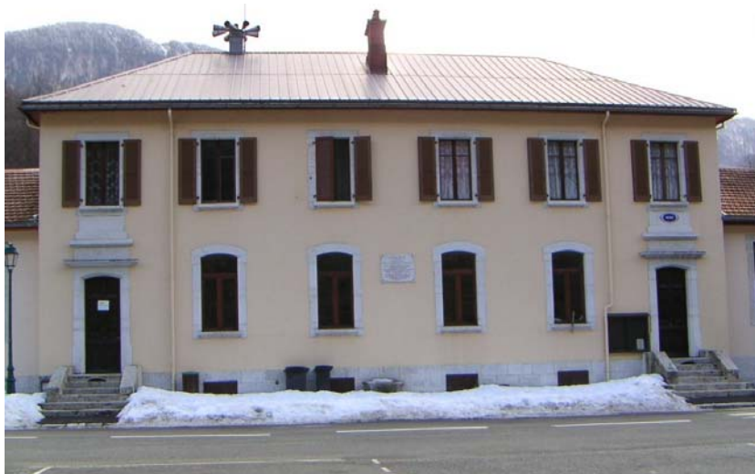
Mairie de Chézery-Forens

Y seront abordés les points suivants: la situation financière de la commune, les travaux réalisés en 2003 et prévus en 2004, les différents projets ainsi que toutes les questions posées par les participants. Cette rencontre se terminera par le verre de l'amitié.