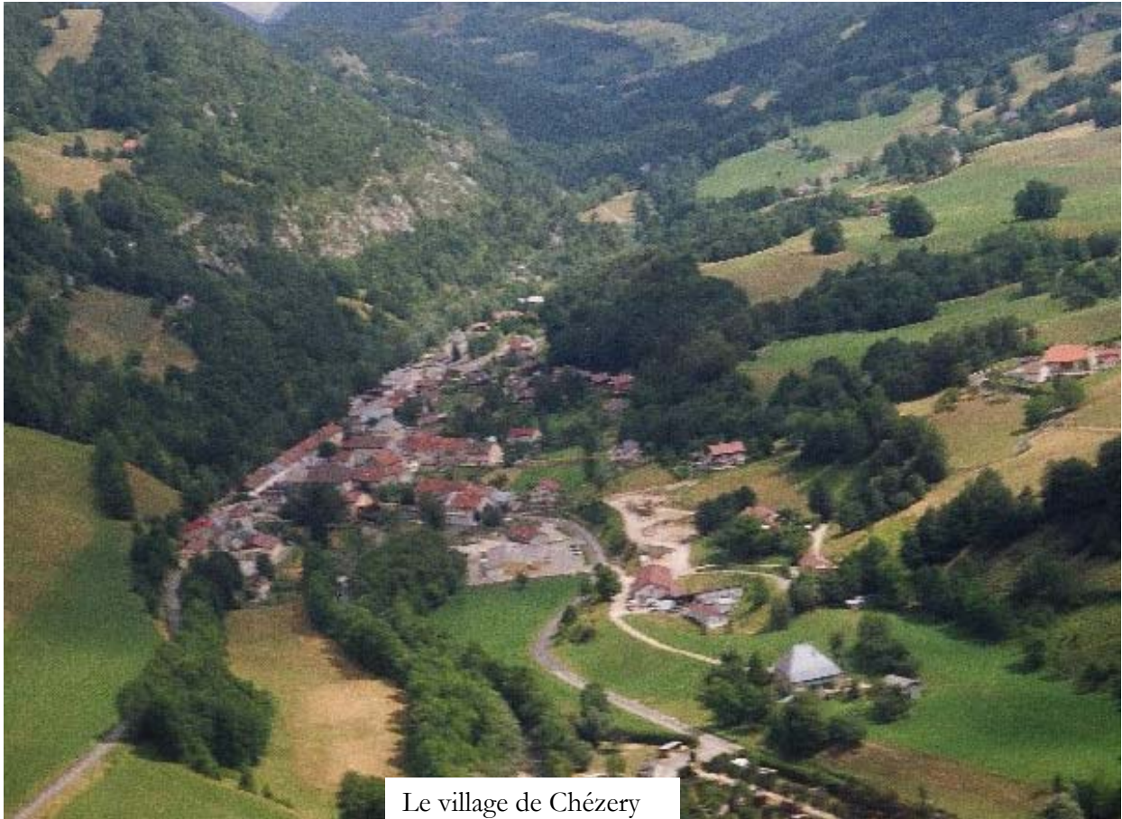
Le village de Chézery